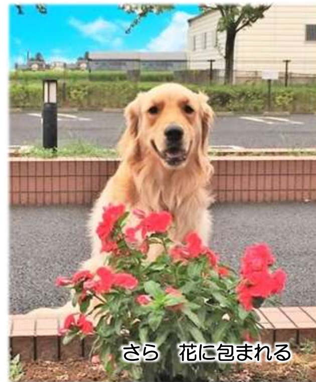
さら 花に包まれる